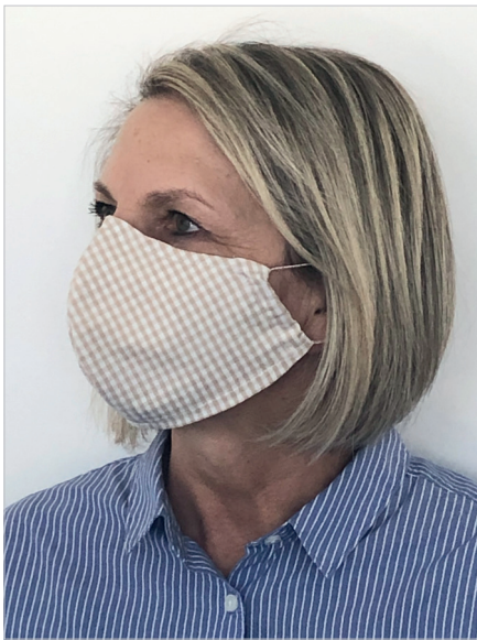
Abbildung zeigt Größe L