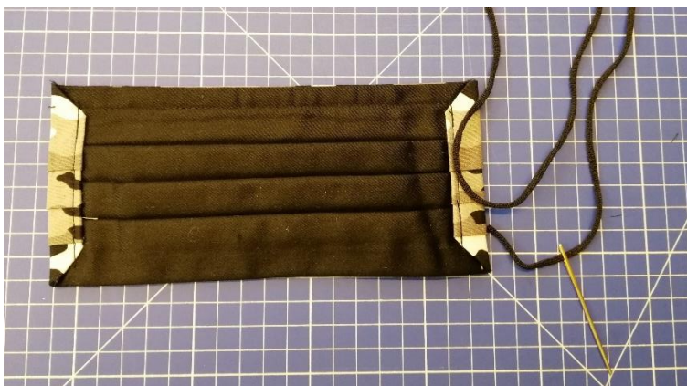
Links und rechts Gummikordel einziehen

Zeitlicher Aufwand pro Maske ca. 10 Minuten Kosten pro Maske bei 30 x tragen 10 Rappen