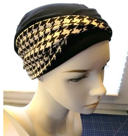
Kombiniert mit einem Stirnband